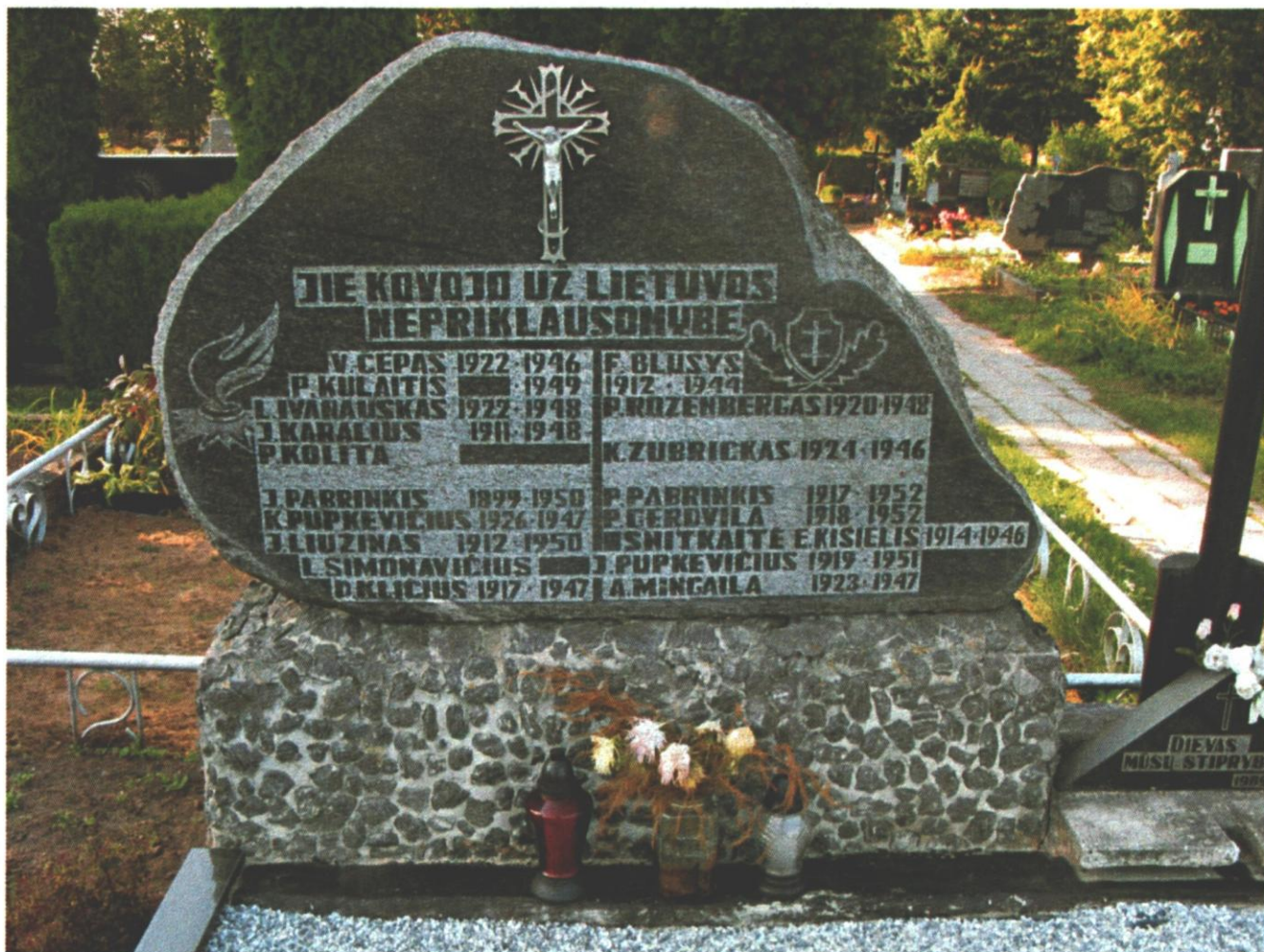
10 pav. Paminklas perlaidotiems Šėtos krašto partizanams