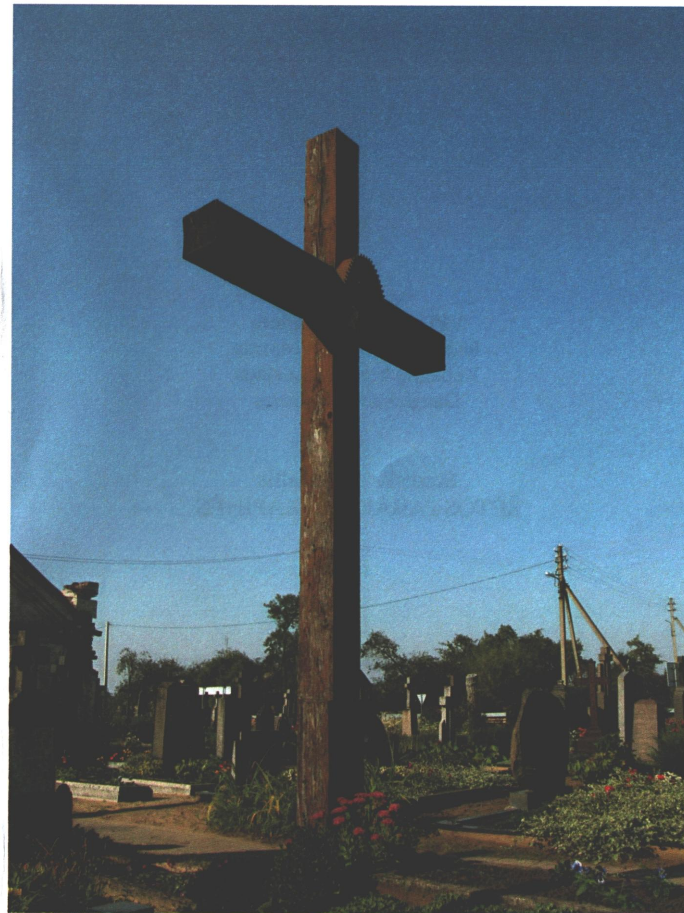
11 pav. Atminimo kryžius kaštiečiams tremtiniam