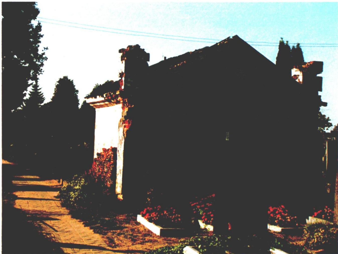
4 pav. Laiko nuniokotas XIX a. kolumbariumas tebestovi