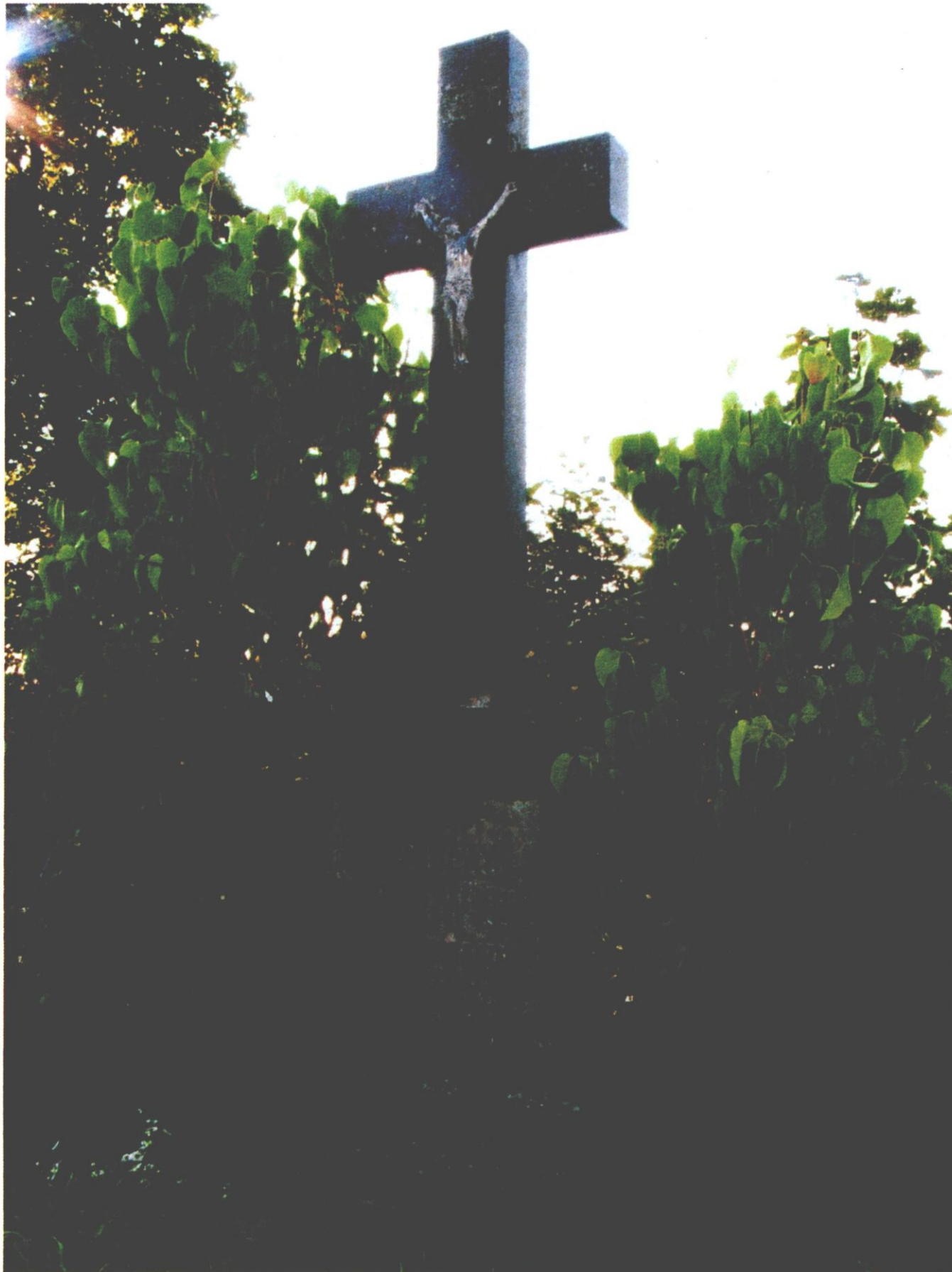
8 pav. Paminklas 1863 metų sukilimo dalyviui Stanislovui Montvilai