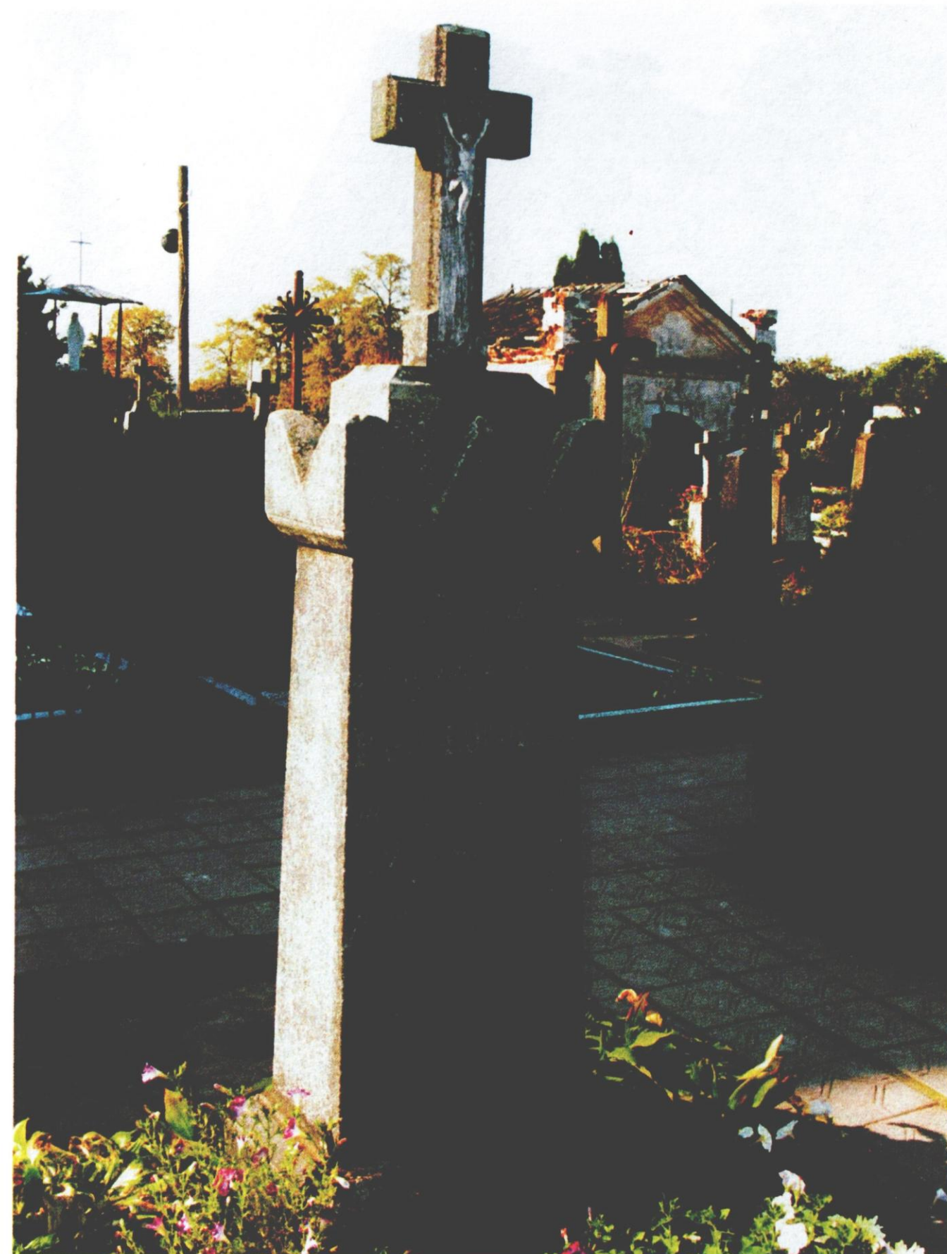
7 pav. Antkapinis paminklas Povilonių šeimos nariams