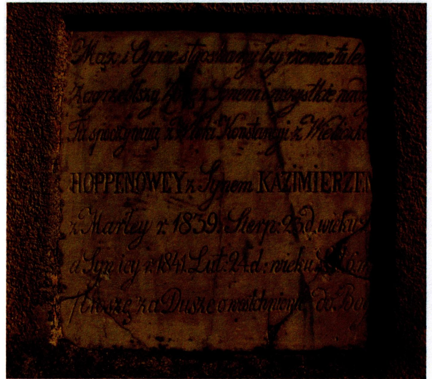
3 pav. Memorialinė lenta kapinių koplyčios išorinėje sienoje Veličkų šeimos nariams - žmonai Konstancijai ir jos sūnui Kazimierui