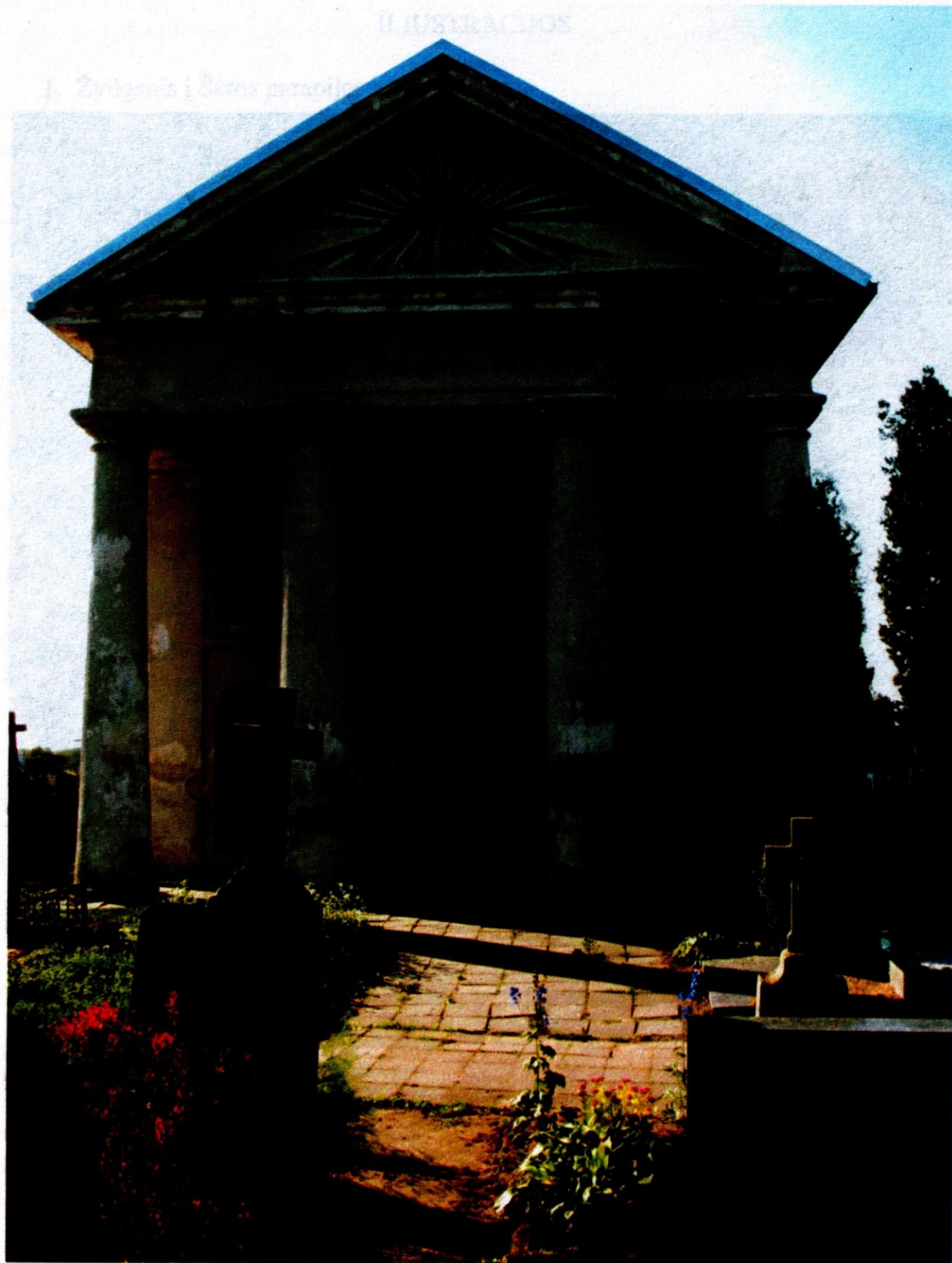
2 pav. Kapinių koplyčia - XIX a. pirmosios pusės paminklas