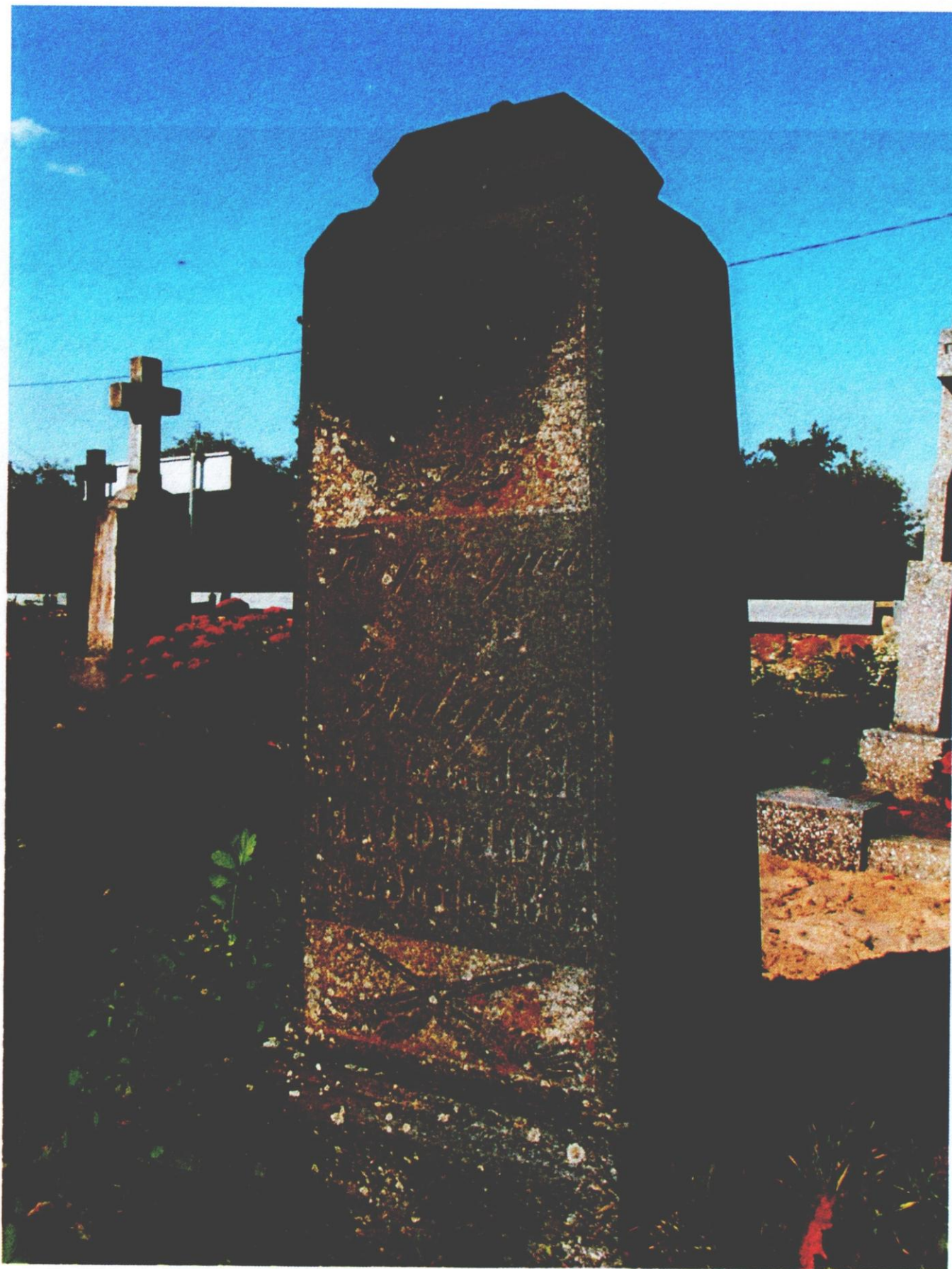
6 pav. Antkapinis paminklas Julijai Gintautienei su giminės herbu