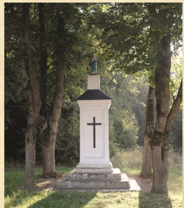
Buvusio Montvilų dvaro Mitėniškiuose koplytėlė.