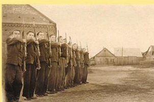
1941 m. sinagogoje buvo įkurta progimnazija.