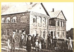
Žydų sinagoga iki karo.

Nacistinės Vokietijos okupacijos metais sudegė Šėtos progimnazijos pastatas, bankas, vaistinė, naujoji sūrinė ir kiti pastatai. Nuo nacių rankų pirmosiomis karo dienomis žuvo 14 valsčiaus gyventojų, Šėtos valsčiuje sudegė 89 gyvenamieji namai. Kėdainiuose, Daukšių kaime, sušaudytos 69 Šėtos žydų šeimos – 211 žmonių, 45 šėtiškiai buvo išvežti darbams į Vokietiją. Kėdainių priemiestyje Babėnuose 1941 m. liepos 23 d. buvo sušaudyti 1940 - 1941 m. Šėtos valsčiaus sovietiniai aktyvistai. Išnaikintos Šėtos žydų bendruomenės namuose – sinagogoje kūrėsi vidurinė mokykla.