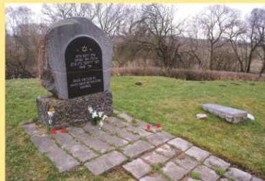
Paminklas buvusios žydų kapinėse.