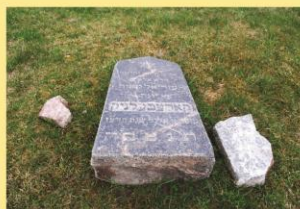
Žydų paminklai rasti 2011 m. prie buvusios sinagogos. Sovietmečiu kapinių paminklai buvo sudėti į statomų kolūkio fermų pamatus.