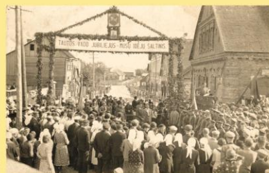
Šėta 4-ojo dešimtmečio viduryje, sutinkamas Lietuvos prezidentas Antanas Smetona.