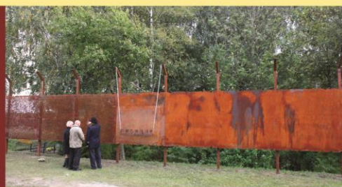
Šėtos, Zeimių ir Kėdainių žydų susauldymo vieta Daukšių km. prie Kėdainių. Jų atminimui 2011 m. pastatytas paminklas.