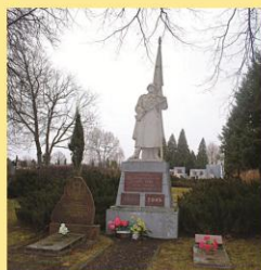
Karių kapinėse palaidoti 236 sovietiniai kareiviai. Iš jų tik 97 yra žinomos pavardės.