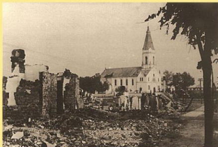
Sudegęs Šėtos miestelis 1941 m. vasarą.

Nacistinės Vokietijos okupacijos metais sudegė Šėtos progimnazijos pastatas, bankas, vaistinė, naujoji sūrinė ir kiti pastatai. Nuo nacių rankų pirmosiomis karo dienomis žuvo 14 valsčiaus gyventojų, Šėtos valsčiuje sudegė 89 gyvenamieji namai. Kėdainiuose, Daukšių kaime, sušaudytos 69 Šėtos žydų šeimos – 211 žmonių, 45 šėtiškiai buvo išvežti darbams į Vokietiją. Kėdainių priemiestyje Babėnuose 1941 m. liepos 23 d. buvo sušaudyti 1940 - 1941 m. Šėtos valsčiaus sovietiniai aktyvistai. Išnaikintos Šėtos žydų bendruomenės namuose – sinagogoje kūrėsi vidurinė mokykla.