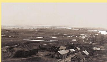
Miestelio vaizdas 6-ojo dešimtmečio pradžioje.