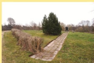
Žydų kapinės šandien.