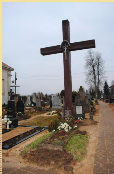
Kryžius ant simbolinio tremtinių kapo Šėtos kapinėse. Pastatytas 1991 metais birželio 14 d.