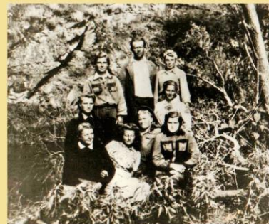
Sielių plukdymo brigada 1951 m.