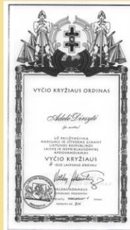
A. Diršytė po mirties apdovanota Vyčio kryžiaus ordinu.