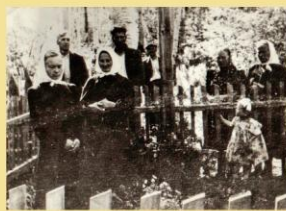
Lietuvių tremtinių kapinės Labaznos kaime. 1956 m.