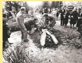
Partizanų palaikų perlaidojimas Šėtos kapinėse.