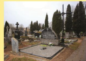
Šėtos partizanų bendras kapas perlaidojus palaikus 1989 m.