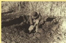
Šioje vietoje, šalia buvusių žydų kapinių, sovietų valdžia užkase nulautus Šėtos krašto partizanus.