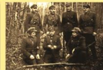
Vinco Gėgžnos būrio partizanai.