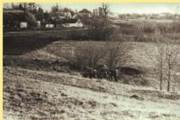
Partizanų palaikų paieška 1989 m.