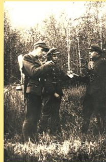
V. Gėgžnos būrio partizanai.