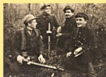
Šėtos apylinkių partizanai.