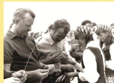
Šėtos vidurinės mokyklos mokėmės į laukus palydi kombainininkus.