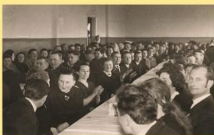
Šėtos kolūkio ataskaitinis susirinkimas.