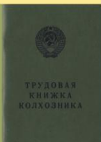
Kolūkiečio darbo knygelė.