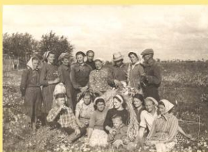
Šėtos kolūkio lauko darbininkų brigada.

1947 m. Lietuvoje sovietų valdžia pradėjo prievarta varyti gyventojus į kolūkius. Šėtos apylinkėse buvo sukurti 4 nedideli kolūkiai, kurie 1949 m. buvo sujungti į vieną, vadintą Šėtos kolūkiu. Jam buvo perduotas nacionalizuota lentpjūvė, Pakščių malūnas ir kt. 1977 m. stambinant kolūkius prie jo buvo prijungtas gretimas Piliakalnio kolūkis.