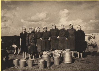
Šėtos kolūkio melžėjos.

1947 m. Lietuvoje sovietų valdžia pradėjo prievarta varyti gyventojus į kolūkius. Šėtos apylinkėse buvo sukurti 4 nedideli kolūkiai, kurie 1949 m. buvo sujungti į vieną, vadintą Šėtos kolūkiu. Jam buvo perduotas nacionalizuota lentpjūvė, Pakščių malūnas ir kt. 1977 m. stambinant kolūkius prie jo buvo prijungtas gretimas Piliakalnio kolūkis.