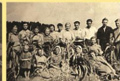
Lauko darbininkai kukurūzų lauke.