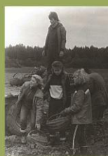
Mokėmėi kolūkio laukuose nairamė dierlių.