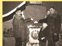
Rinkimai į LSSR Aukščiausiąją Tarybą.